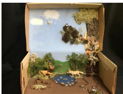
Dana Beaudin Cuervo