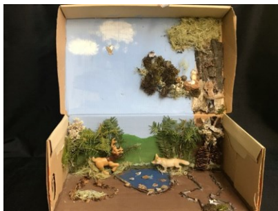
Dana Beaudin Cuervo