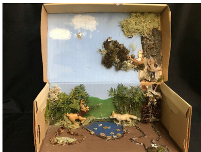
Dana Beaudin Cuervo